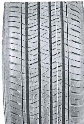
Hình 4: Mẫu vân lốp