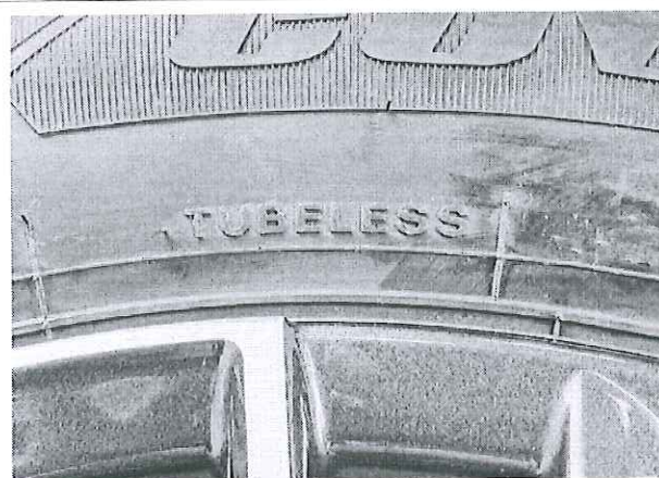
Hình 5: Lốp là loại có/không sử dụng sảm