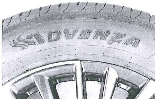
Hình 1: Nhân hiệu