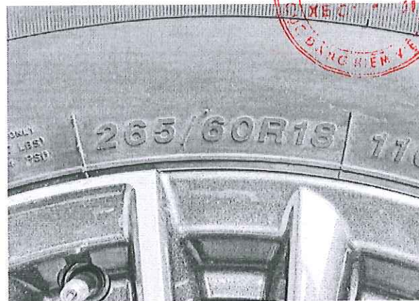
Hình 2: Ký hiệu kích cỡ lốp